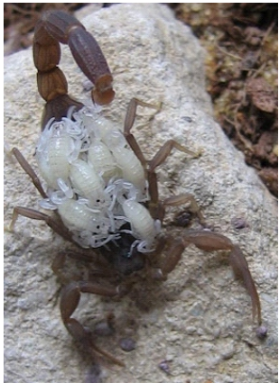
Figura 3. Hembra de alacrán con sus crías en el dorso.

Se debe tener especial cuidado cuando se revisan lugares oscuros y húmedos dentro del domicilio o cuando se examinan cajones o estantes. Es importante, asimismo, no caminar descalzo, especialmente de noche, en lugares donde exista la probabilidad de existencia de alacranes. Como última alternativa, y con el asesoramiento especializado, se pueden aplicar insecticidas de baja toxicidad por personal entrenado.